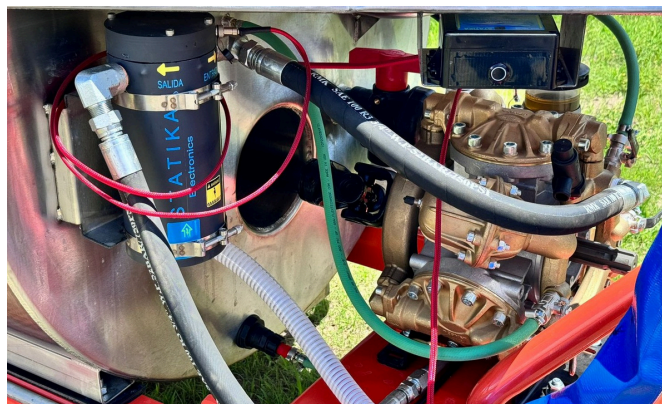
Forma en que queda instalado

el cuadro superior identifica en una huerta de 900 hectáreas la diferencia de usar o no un sistema electrostático