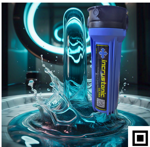
INCRUSTRONIC ULTRA 3/4"